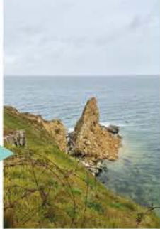
La Pointe du Hoc, mai 2022 : Le 5 mai 2022, le rocher en avant de la Pointe du Hoc, déjà isolé en mer, s'effondre à moitié sur son pan est.