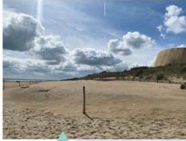
Le musée Utah Beach, mai 2022 La question de l'emplacement du musée est aujourd'hui soulevée, vis-à-vis d'une côte fragile et maintenue par des rechargements de la plage en sable.

Les sites mémoriels des Plages du Débarquement se situent sur des côtes en érosion ou accrétion (Figures 1 et 2). En parallèle, une mutation de la fréquentation touristique avec des circulations douces établit un nouveau rapport au littoral.