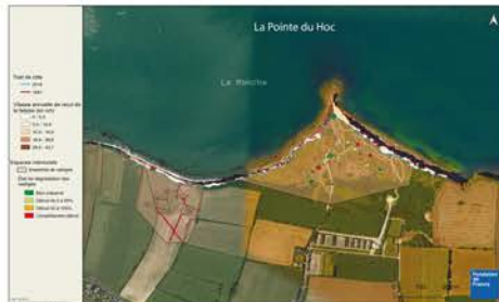
Figures 4 et 5