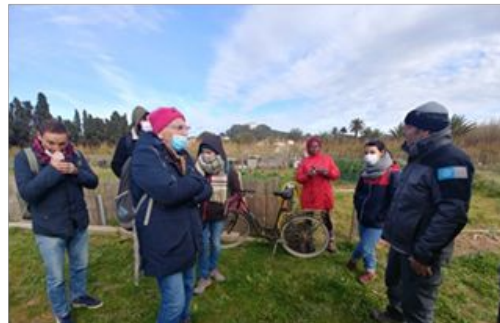
Les jardins, les vignes, le maraichage