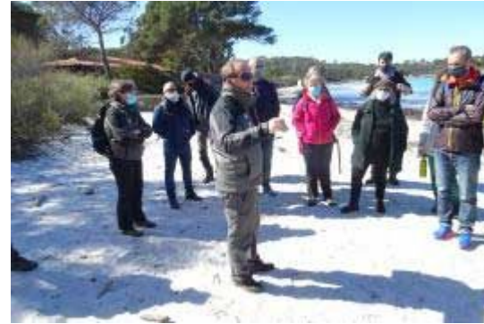
La mer, les rivages et le tourisme