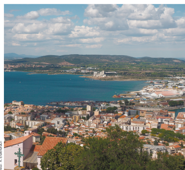
Sète, Frontignan et l'étang de Thau

Le projet est mené dans trois régions françaises : Nouvelle Aquitaine, Occitanie et Provence Alpes Côte d'Azur, avec des focus pour les enquêtes sur une commune en Occitanie (Frontignan) et une commune en PACA (Sainte Maxime). Il comprendra également une enquête en ligne concernant les communes du littoral métropolitain.